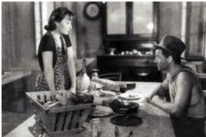
Clara Calamai e Massimo Girotti em Obsessão , de Luchino Visconti (1943)

seguro. O filme foi considerado uma afronta aos valores cristãos da família. Os fascistas detestaram e a Igreja censurou.