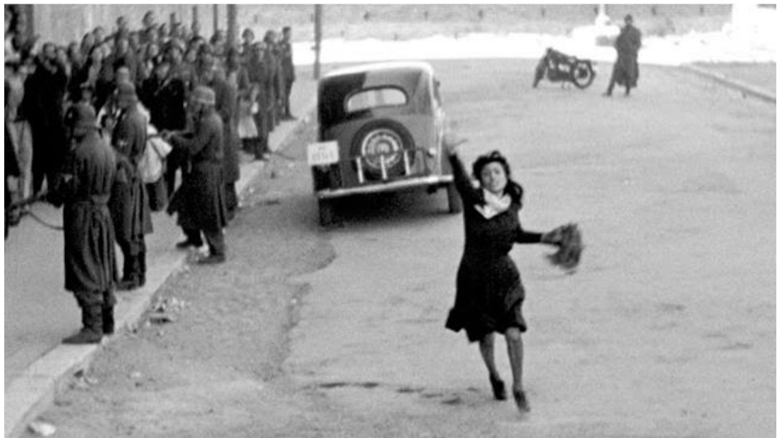
Anna Magnani, como Pina, em Roma, Cidade Aberta , de Roberto Rossellini (1945)

Mas Roma, Cidade Aberta foi rejeitado pela crítica italiana. Os franceses, ao contrário, o consagraram como obra-prima no Festival de Cannes de 1946, dando-lhe o prêmio máximo e possibilitando sua circulação mundial.